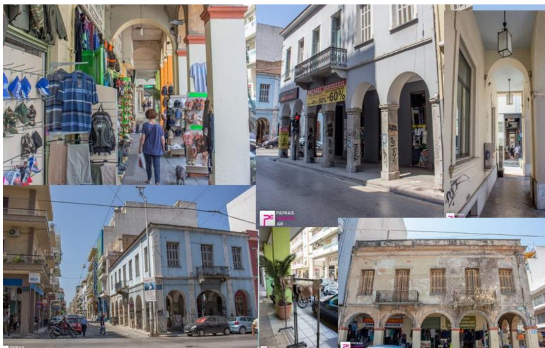
Ιστορικό κέντρο, η Κανακάρη στη συμβολή της με την Αγ. Νικολάου.