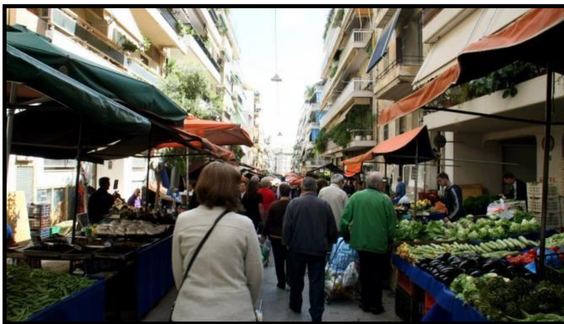
Η λαϊκή αγορά του Σαββάτου στο ιστορικό κέντρο.

Το συμβολικό κεφάλαιο και την υψηλή αισθητική αξία του ιστορικού κέντρου, θα το ιδιοποιηθεί το επενδυτικό κεφάλαιο που θα προσελκυθεί στην περιοχή, μετατρέποντάς τις υπάρχουσες γειτονιές του κέντρου σε νέες, διαφορετικού πολιτισμικού φορτίου, trendy και luxury κατανάλωσης.