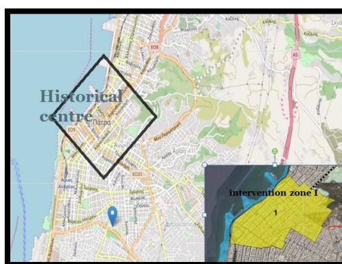
Το ιστορικό κέντρο Πάτρας, ζώνη παρέμβασης I

Σήμερα, η τοπική αυτοδιοίκηση διαδραματίζοντας κομβικό ρόλο στην υλοποίηση των πολιτικών της Ε.Ε. για την αστική ανάπτυξη προς την κατεύθυνση του εξευγενισμού, διεκδικεί την εφαρμογή του νέου στρατηγικού σχεδιασμού αστικής διαχείρισης, ενταγμένου στη χρηματοδότηση Σχεδίου Ολοκληρωμένων Χωρικών Επενδύσεων (ΟΧΕ) ΕΣΠΑ 2014-2020. 8 Η συστηματική προώθηση ενός λόγου για την αναγκαιότητα αναπλάσεων, που προηγήθηκε τα προηγούμενα χρόνια, δημιουργεί ένα πλαίσιο – και έναν ηθικό χώρο– καθολικής σχεδόν αποδοχής και συναίνεσης γύρω από ένα τέτοιου είδους σχεδιασμό, με καταφανή την απουσία ενδοιασμών ή προβληματισμών για τις ενδεχόμενες κοινωνικές συνέπειες και αποκλεισμούς που συνεπάγεται η υλοποίησή του.